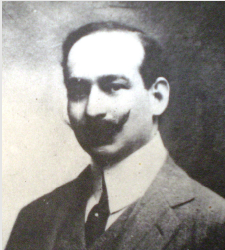
José Ingenieros (1877 - 1925)

"Juventud sin rebeldia es servidumbre precoz ."