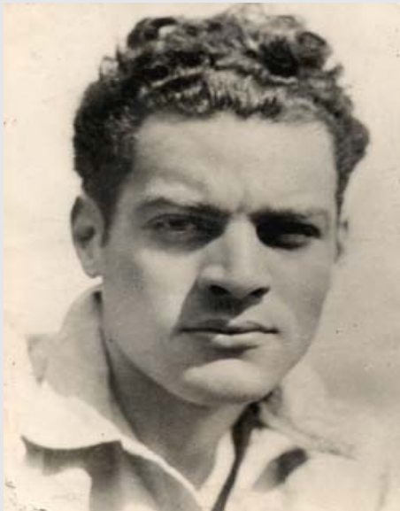
Julio Antonio Mella (1905 - 1929)