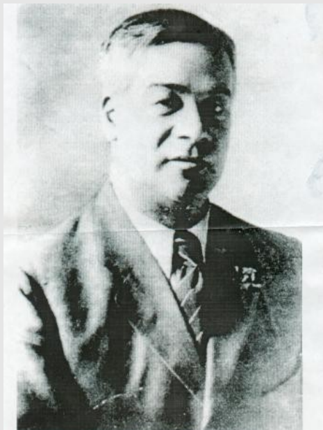
Luis Emilio Recabarren (1876 - 1924)

La lectura es uno de los mejores medios de emancipación de las clases trabajadoras. Por eso aconsejamos que lean mucho